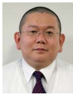
長山 雅晴 教授(電子研)