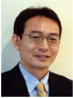
福山 博之 教授(多元研)