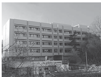
研究所内にある企業リサーチパーク棟