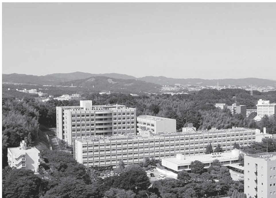
大阪大学産業科学研究所