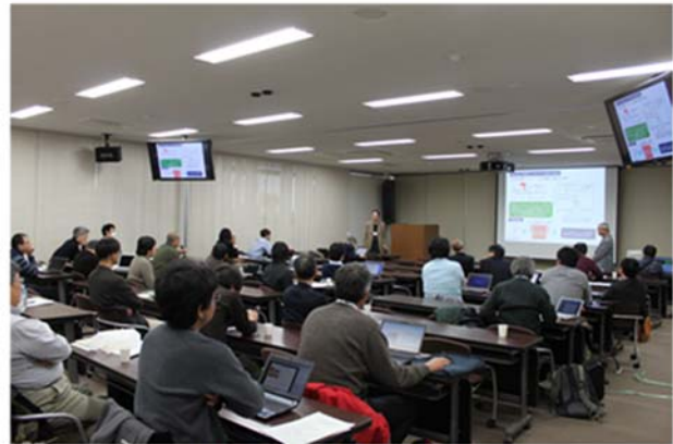
写真 研究会の様子

平成 26 年度第 4 回量子ビーム科学研究施設研究会（第 21 回 FEL と High-Power Radiation 研究会）は、2014 年 12 月 11 日（木）－12 日（金）に産業科学研究所 管理棟 1 階講堂で開催された。この研究会は、自由電子レーザー（Free-Electron Laser, FEL）と関連する分野に関する国内唯一の研究会として「FEL と High Power Radiation に関する Topical Meeting」という名称で 1991 年から国内の関連する研究機関によりほぼ毎年開催されてきた。途中で名称を現在の「FEL と High-Power Radiation 研究会」に変更しながら継続され、今年で第 21 回目を迎えた。大阪大学としては 1999 年の産業科学研究所、2005 年の自由電子レーザー研究施設に続き、3 回目の開催となった。