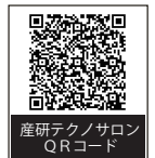
産研テクノサロン QRコード