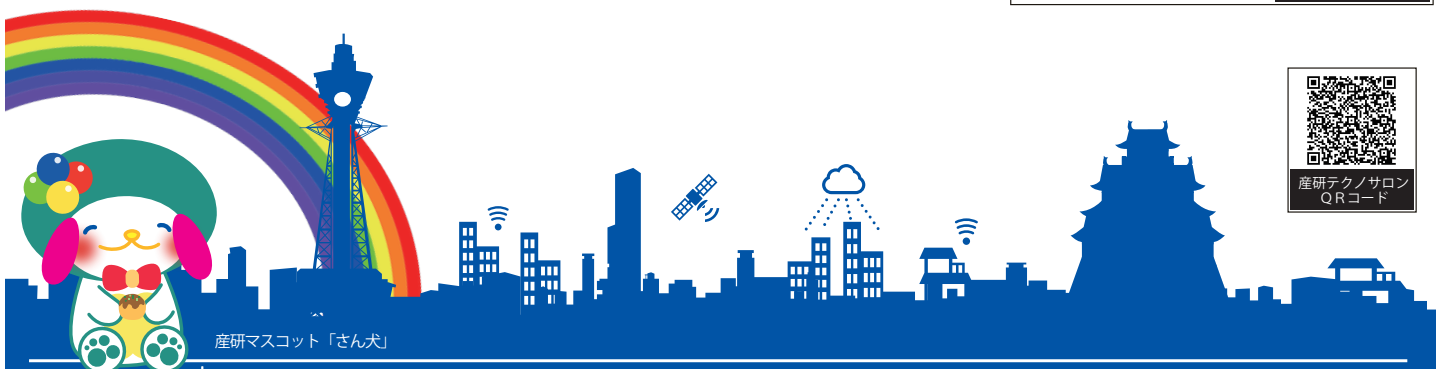
産研マスコット「さん犬」