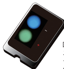
図2. スマートフォン搭載のカメラでカラー観察することで、特定成分の血中濃度を簡便・迅速に検出可能