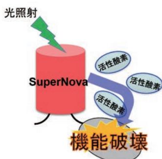
図1. SuperNova の概念図

我々は光により活性酸素を放出する光増感物質を用いるタンパク質機能破壊法 CALI (Chromophore assisted light inactivation) の開発に取り組み、光増感蛍光タンパク質 SuperNova (図1) の開発とそれを用いた細胞内分子機能破壊に成功しました。また植物由来の青色光の吸収によって立体構造を変化させる光受容タンパク質の LOV ドメインと \text{Ca}^{2+} 結合タンパク質カルモジュリンから成るケイジド \text{Ca}^{2+} タンパク質 PACR を開発し、生体内 \text{Ca}^{2+} 操作に成功しました (図2)。本技術はミトコンドリアや核など細胞内小器官特異的に生理機能を操作することが可能です。