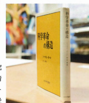
▲トーマス・クーン著「科学革命の構造」