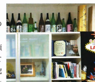
▲研究室の棚の上には日本酒のビンがずらり。お酒は人との交流の一翼を担う

研究者として大切にしているのは、人との交流。「物理・化学・生物・工学・人文学などの幅広い知識を頭に入れ、多方面にアンテナを張っていることが大事」と、産業科学研究所では150人を超える大人数のジンギスカンパーティを毎年開催。今年3月には、研究所内に、飲食しながら議論ができるサロンも開設するという。「これからの研究者は引っ込み思案ではダメですよ。常識を疑い『ばっばらばー』的発想をする人間と積極的に交流しないといけません」