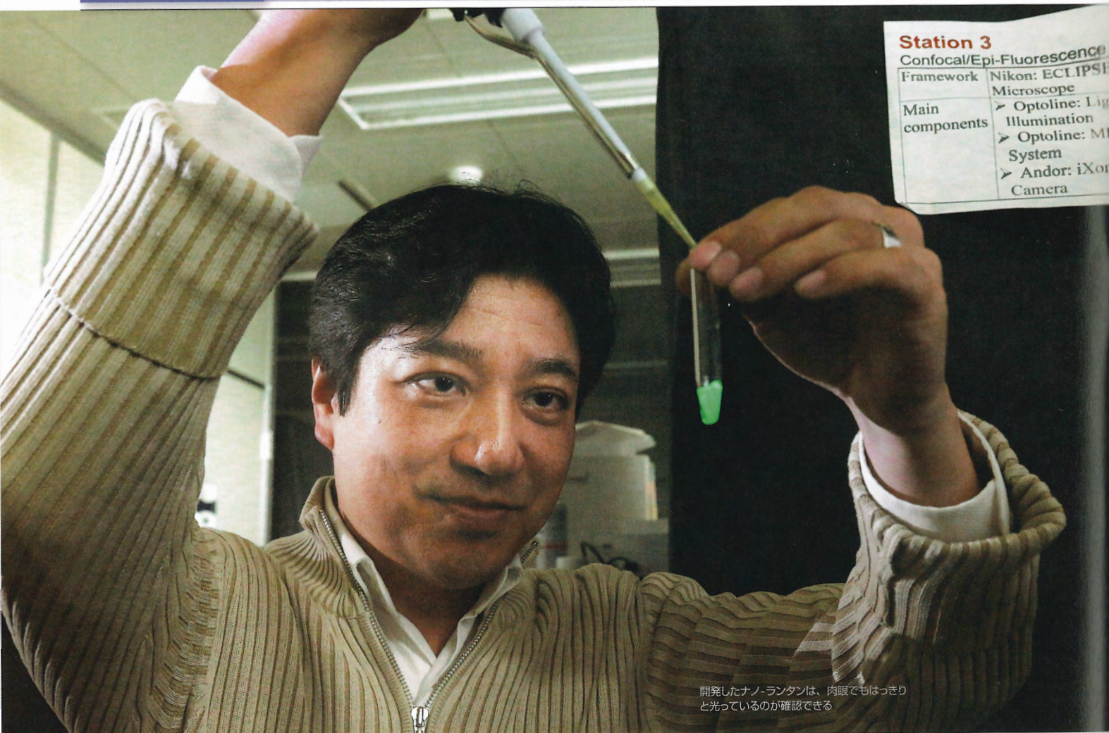
開発したナノ-ランタンは、肉眼でもはっきりと光っているのが確認できる